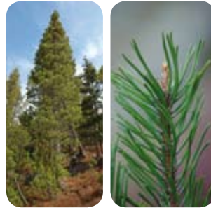
BERGFÖHRE (PINUS MUGO)

70 Prozent aller Bäume in La Niva sind Bergföhren. An Orten wie La Niva, wo das Überleben hart ist, sind Bergföhren anderen Baumarten überlegen. Sie kommen mit sehr wenig Nährstoffen aus, ertragen Trockenheit, Hitze und Kälte. In den östlichen Alpen hat sich auch eine Form herausgebildet, die besonders gut an Schneerutschungen angepasst ist. Die sogenannten Legföhren wachsen niedrig, die Äste folgen dem Untergrund und bieten so einen geringen Widerstand gegen die Schneemassen.