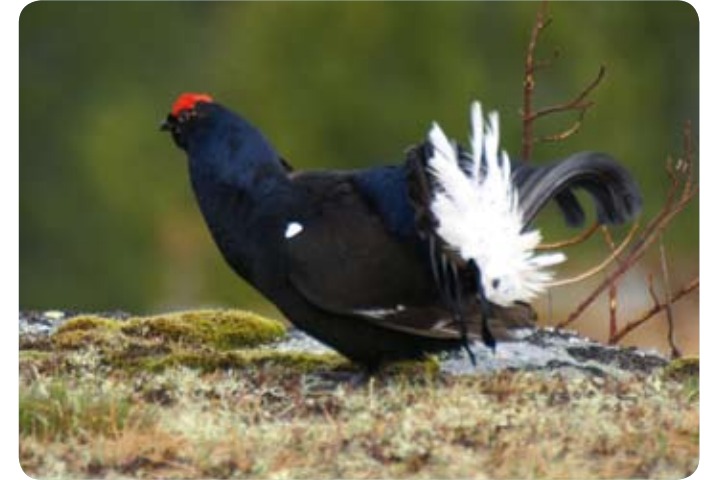
BIRKHAHN BEIM BALZEN.

Wie die ganze Familie der Seidelbaste hat es auch der gestreifte Seidelbast in sich: Alle Pflanzenteile sind hochgiftig. Früher wurde der Seidelbast als Abführmittel und gegen Melancholie, Herzschwäche oder Geschwüre verwendet. Die alten Germanen nannten den Strauch „Ziolinta“ nach ihrem Kriegsgott Tyr (althochdeutsch „Ziu“). Daraus entstand der heutige Name. Der gestreifte Seidelbast ist charakteristisch für lichte Nadelwälder in den Ostschweizer Alpen.