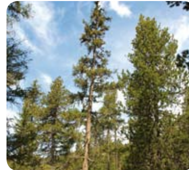
FICHTE (PICEA ABIES)

Die Fichte (oder Rottanne) ist ein Baum der Berge. Doch in La Niva stösst auch die Gebirgsspezialistin an ihre Grenzen. Nur 29 Prozent der Bäume hier sind Fichten. Diese erreichen bei weitem nicht die Höhe von 50 Metern, zu der sie in tieferen Lagen aufwachsen können.