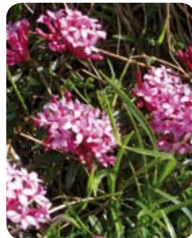
GESTREIFTER SEIDELBAST (DAPHNE STRIATA)

Wie die ganze Familie der Seidelbaste hat es auch der gestreifte Seidelbast in sich: Alle Pflanzenteile sind hochgiftig. Früher wurde der Seidelbast als Abführmittel und gegen Melancholie, Herzschwäche oder Geschwüre verwendet. Die alten Germanen nannten den Strauch „Ziolinta“ nach ihrem Kriegsgott Tyr (althochdeutsch „Ziu“). Daraus entstand der heutige Name. Der gestreifte Seidelbast ist charakteristisch für lichte Nadelwälder in den Ostschweizer Alpen.