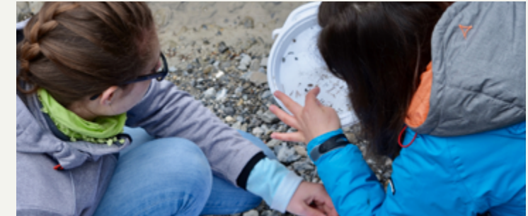
Im Bergquellwasser gibt es einiges zu entdecken

Willkommen am Wasser – Bepackt mit Forschungsutensilien nehmen wir bei Salouf einen Bergbach unter die Lupe. Fliesst da wirklich nur reines Bergquellwasser oder würdet ihr das Wasser nicht trinken? Antworten auf diese Fragen werden eure Messungen und Tierbeobachtungen liefern, die ihr während dieses Forschungstages macht.