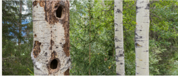
Der Bergwald steckt voller Geheimnisse

Unterwegs in und um Alvaschein entdecken wir gemeinsam das kleine Dorf hoch über der Albula. Wusstest du, dass in Alvaschein Bergbau betrieben wurde oder bei einem Brand fast das ganze Dorf ausgelöscht wurde? Dies und vieles mehr erfährst du auf unserer spannenden Dorf-Schnitzeljagd.