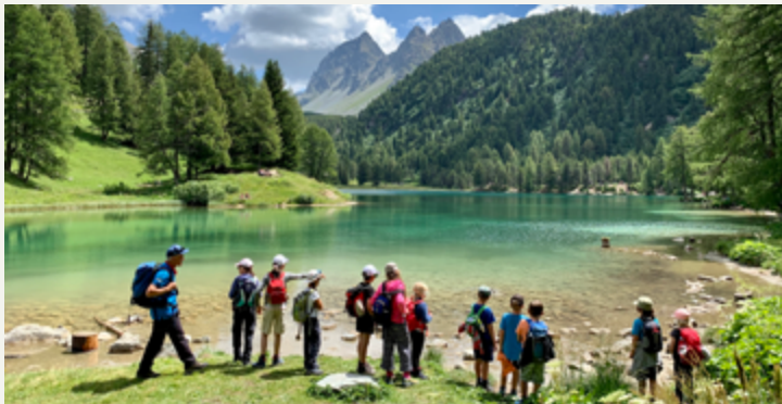
Unterwegs am Palpuognasee mit dem Parc Ela-Ranger, Leo Tempini

Was macht eigentlich ein Ranger oder eine Rangerin? Wir begleiten den Parc Ela-Ranger und erfahren spannende Geschichten rund um den Palpuognasee, warum Schwimmen dort gefährlich ist oder warum die dort lebenden Enten nicht gefüttert werden sollten.