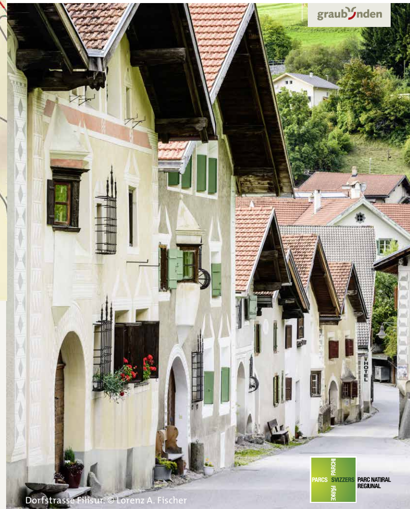
Dorfstrasse Filisur.