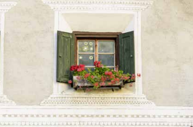
Bilder von links nach rechts: Haus J.P. Schmidt, Chesa Antupada, Chesa Fontana, Haus Tgetgel, Chesa Cuminanza, Hof Streglia.

Filisur im Parc Ela ist ein Engadiner Dorf mit einem historischen Dorfkern von nationaler Bedeutung. Auf der «FiliTour» können Sie 14 der prächtigen Engadinerhäuser interaktiv entdecken. In Text, Bild und Ton erfahren Sie erstaunliche Geschichten rund um die Häuser, ihre Architektur und ihre einstigen und heutigen Bewohnerinnen und Bewohner.