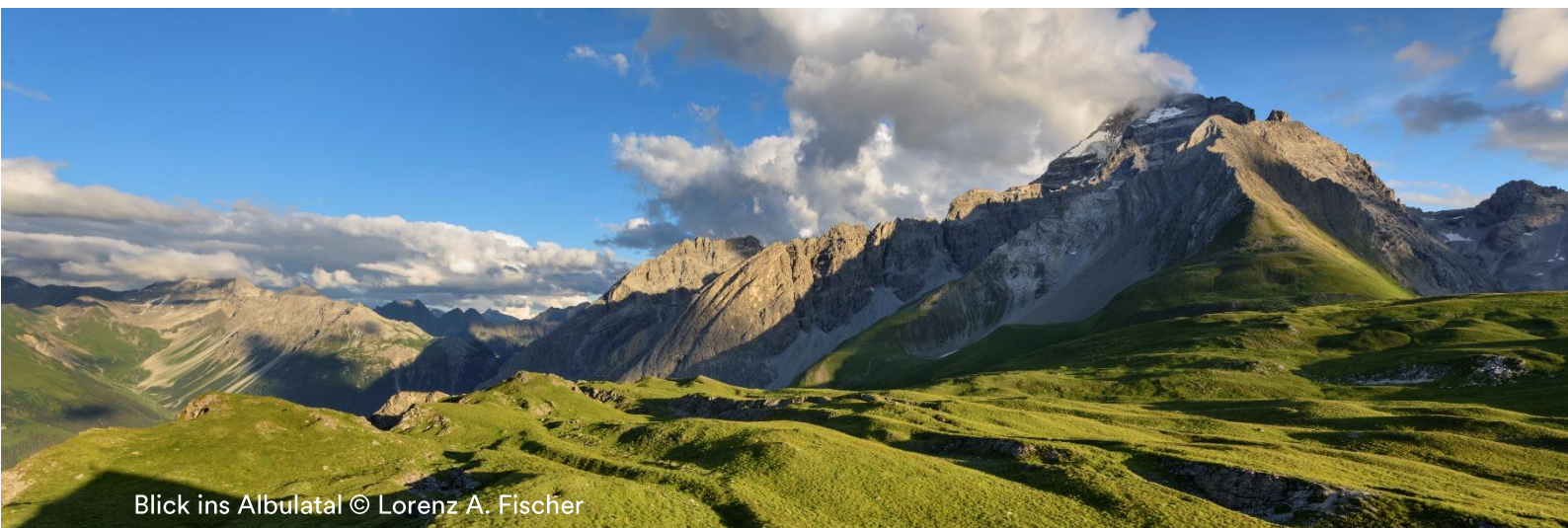
Blick ins Albulatal