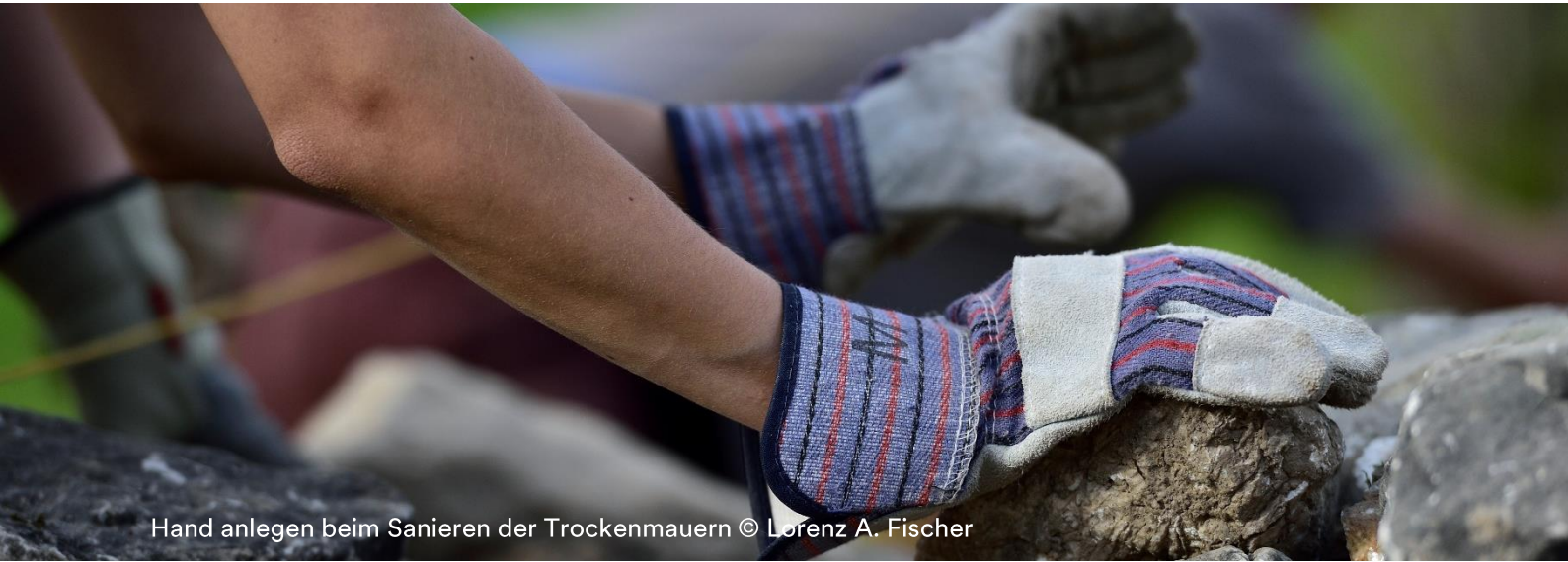
Hand anlegen beim Sanieren der Trockenmauern