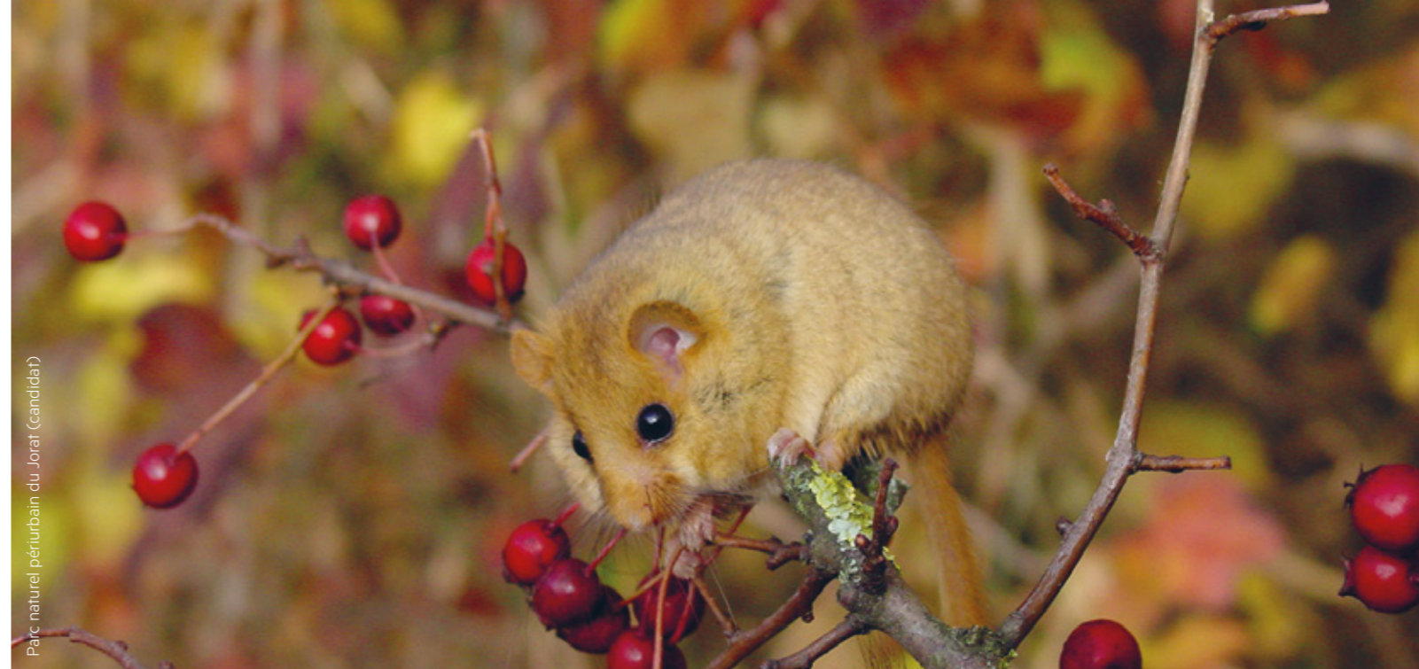
Parc naturel périurbain du Jorat (candidat)

A proximité des agglomérations urbaines, ce parc comprend des biotopes intacts qui révèlent une flore et une faune abondante. De plus, sa zone périphérique permet aux visiteurs de découvrir la nature grâce à différentes activités.