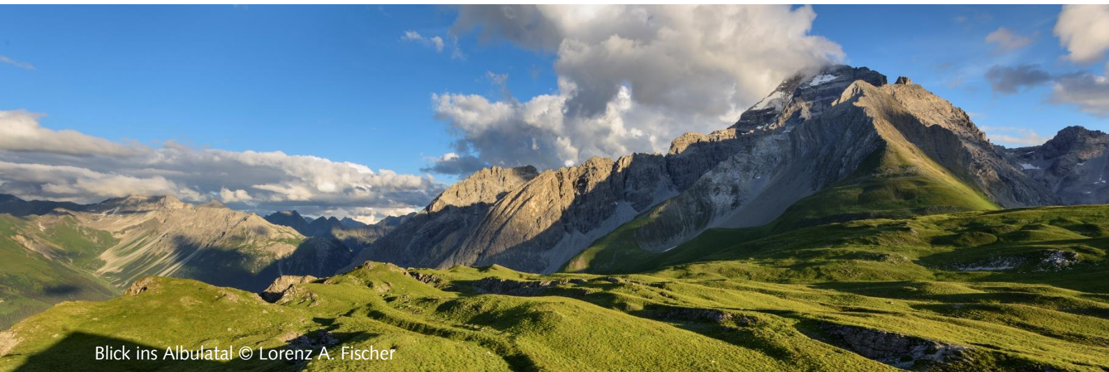
Blick ins Albulatal

Trockenmauern sanieren als Teamerlebnis (Juni – September)