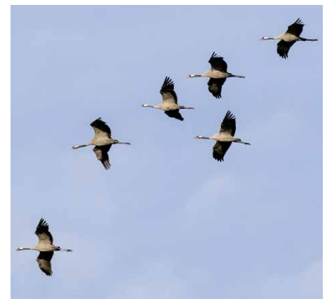
Ziehende Kraniche