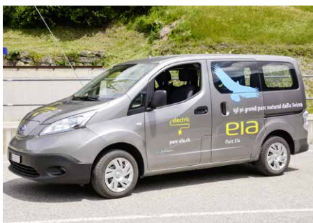
Das Parc Ela-Elektrofahrzeug ab Juli einsatzbereit.

Gemeinden beispielhaft das vielfältige Angebot an öffentlichen Verkehrsmitteln, Wanderbussen, Bergbahnen und E-Bikes im Park. Eine Broschüre informiert über das Angebot, zusätzlich lädt ein Infostand an vier Dorfmärkten spielerisch dazu ein, entschleunigt mobil auf Entdeckungsreise im Parc Ela zu gehen.