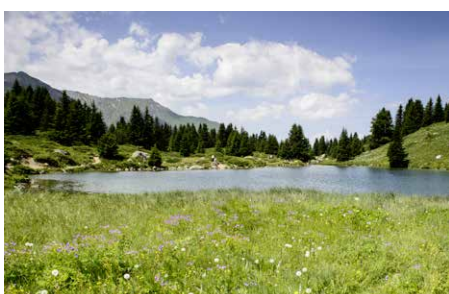
Die Alp Flix

Die Alp Flix ist eines der bekanntesten und beliebtesten Gebiete im Parc Ela. Was genau gefällt und woran stören sich Gäste, Einheimische und Zweitwohnungsbesitzer? Das Forschungsprojekt «What's Flix?» der HTW Chur geht diesen Fragen nach. Von Juli bis September können Besucherinnen und Besucher auf der Alp Flix ihre Eindrücke in der App «experiencefellow» festhalten. Mitarbeitende der HTW Chur erklären an mehreren Tagen die Anwendung der App vor Ort. Das Forschungsteam wertet die App-Reisetagebücher anschliessend aus, um Empfehlungen für mögliche Aufwertungen der Alp Flix zu erarbeiten. Teilnehmende des Projekts können mit etwas Glück einen Preis gewinnen. Infos: parc-ela.ch/forschung .